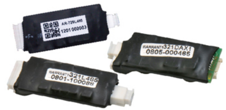
TTL/RS-485轉換器 AR-725L485 AR-321L485 AR-321DAX1