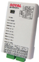
串列設備連網伺服器・連網遠端I/O控制器 AR-727CM・AR-727CM-IO