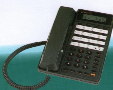
901D 多功能顯示型單機