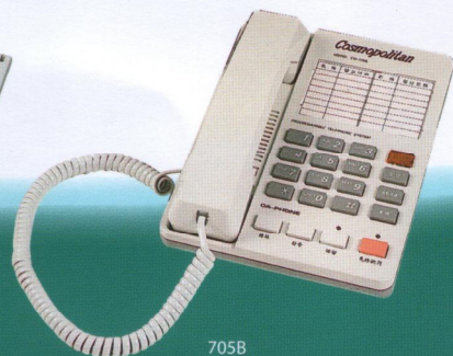
705B 辦公室 / 家庭兩用單機