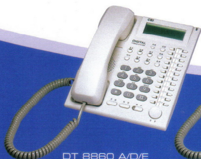
DT 8860 A/D/E 24鍵顯示型 / 豪華型 / 耳機型 數位話機