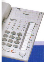
350 S 型數位話機