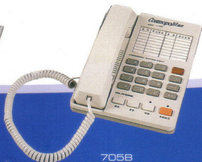
705B 辦公室 / 家庭兩用單機