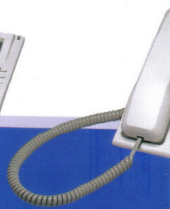
DT 8850 S 12鍵標準型數位話機