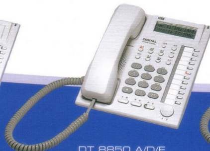
DT 8850 A/D/E 12鍵顯示型 / 豪華型 / 耳機型 數位話機