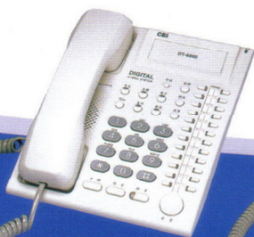
DT 8860 S 24鍵標準型數位話機