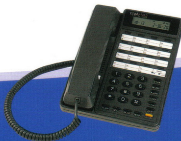
901D 多功能顯示型單機