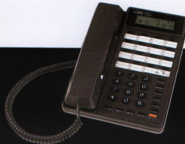
901D 多功能顯示型單機