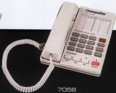
705B 辦公室 / 家庭兩用單機