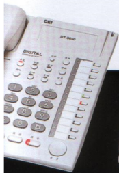
50 S 數位話機