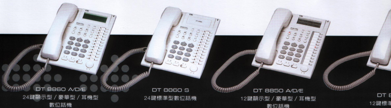
DT 8860 A/D/E 24鍵顯示型 / 豪華型 / 耳機型 數位話機